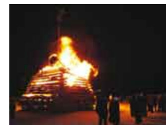
Die Menschen rund um das Feuer schauen den lodernden Flammen zu.