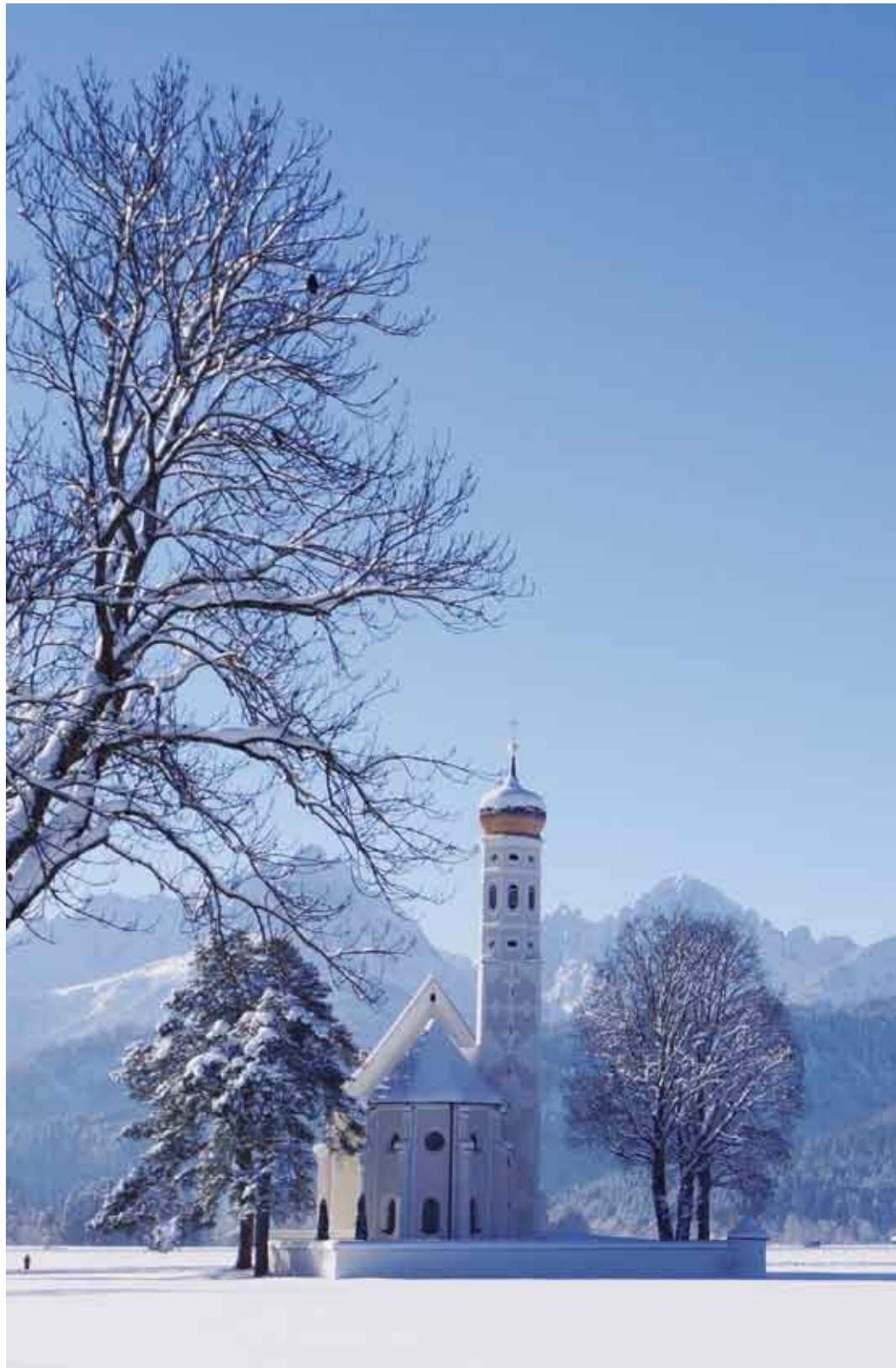
Die Colomankirche, romantisch vor den schneebedeckten Bergen