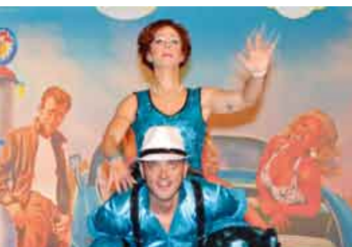
Fasching in Schwangau